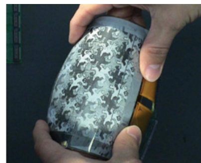
Рис. 5. Гибкий активноматричный электрофоретический дисплей

ным технологиям, займут свою нишу на рынке. Позволим себе предположить, что вскоре E-бумагу будут массово производить, используя технологию электронных чернил, так как по этой технологии достигнута наивысшая удобочитаемость. А гибкие дисплеи будут изготавливаться либо на основе технологии PLED/OLED, так как эта технология позволяет сделать полноцветные яркие экраны, либо на основе композитных ЖК материалов, так как ЖК-технологии являются наиболее дешевыми.