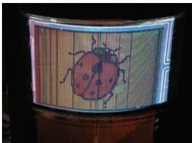
Рис. 3. Первый прототип гибкого STN-дисплея, на котором видны некоторые дисплейные артефакты и проблемы соединения. Размер дисплея 5 × 3 дюйма. Число линий 100 × RGB × 65