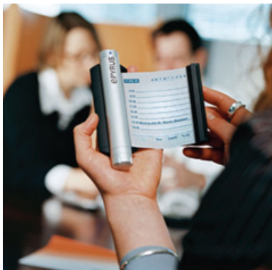
Рис.1. Ежедневник с гибким дисплеем EPyrus