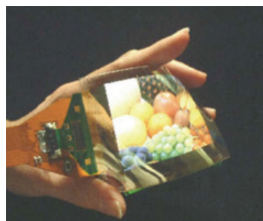
Рис. 4. Полноцветный дисплей на основе технологии OLED. Число линий 160 × RGB × 120

щего дисплей на базе технологии электронных чернил. Чернила эти представляют собой микрокапсулы, заполненные взвесью положительно заряженных частиц белого цвета и отрицательно заряженных частиц черного цвета. В зависимости от поданного к ячейке потенциала, черные или белые частицы в ячейке опускаются вниз, в результате чего ячейка окрашивается в черный или белый цвет. Цена дисплея составляет примерно $375. Основой для новинки, названной LIBRIe, стал дисплей, разработанный ранее Philips на базе технологий американской компании E-Ink.